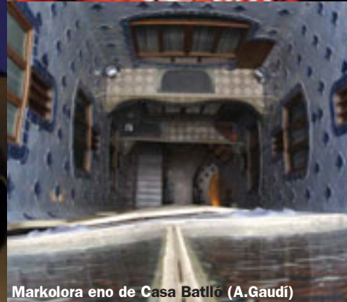
Markolora eno de Casa Batlló (A.Gaudí)