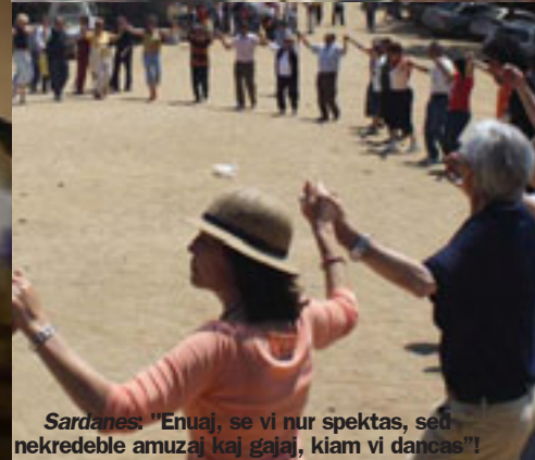
Sardanes: "Enuaj, se vi nur spektas, sed nekredeble amuzaj kaj gajaj, kiam vi dancas"!