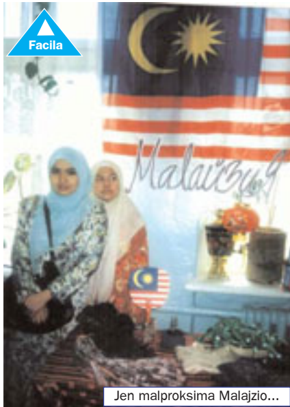
Jen malproksima Malajzio...