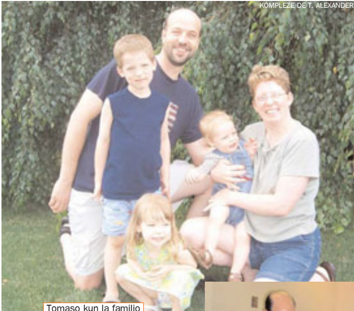
KOMPLEZE DE T. ALEXANDER