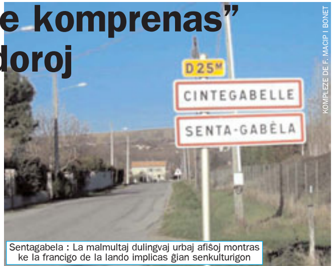
Sentagabèla : La malmultaj dulingvaj urbaj afiŝoj montras ke la francigo de la lando implicas ĝian senkulturigon

Tre ŝokis min, ke la okcitanlingvanoj tute ne konscias, ke la okcitana estas lingvo. Ili kredas, ke ili parolas nur unu lingvon: la francan. Oni konsideras la okcitanan nur lingva tavolo. Kaj oni ne konas la nomon de la lingvo, oni nomas ĝin “patois” [patüa] france aŭ “patoés” [patues] okcitane. Tiu vorto signifas dialekteron, lingvaĉon, fijargonon aŭ aĉan parolmanieron.