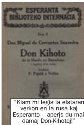
"Kiam mi legis la elstaran verkon en la rusa kaj Esperanto – aperis du maldamadaj Don-Kihotoj!"

Aliajn artikolojn de A.Gonĉarov, rilatajn al la sama temo, vidu ĉe < http://anatolog.narod.ru >