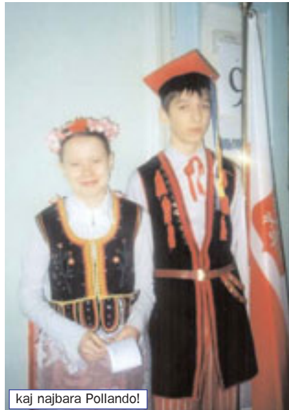
kaj najbara Pollando!