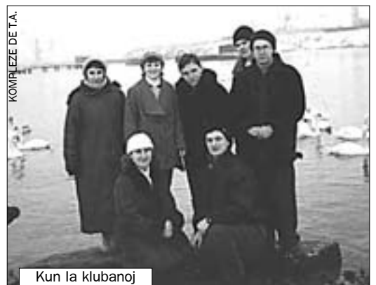
Kun la klubanoj

– Neniel! La reĝisoro (samtempe kameraisto) ĉiam iras al la naturo. Por observi iun birdon kaj ĝiajn kutimojn li povas sidi tagnokte en unu loko kaj atendi, sen moviĝo kaj ĉiam kun preta kamerao. Oni devas vere longe atendi, ĝis okazas io