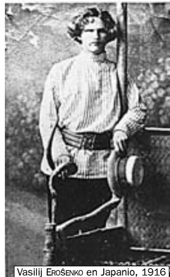
Vasilij EROŝENKO en Japanio, 1916

la Mondo ) aperis artikolo “Vojaĝo de rusa blindulo al Londono”. Tie oni skribis, ke 22-jaraĝa Vasilij EROŝENKO... tiel profunde ellernis Esperanton – ĉefe dank’ al brajla angla-Esperanta vortaro, londonaj revuoj, libroj kaj korespondado kun esperantistoj de Anglio, – ke li rapide ellernis ankaŭ la anglan lingvon. Li eĉ mirigis la anglojn mem per sia kono de la angla porblindula stenografio. La revuo ankaŭ informas, ke dumvoje al Londono al li multe helpis ne nur vidpovuloj, sed ankaŭ blinduloj.