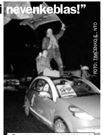
Dum la unuaj revoluciaj tagoj

Memkompreneble, indis atendi, ke aperos multe da kritiko, adresita al ambaŭ kandidatoj. Sed tio, kion mi vidis, superis ĉiujn miajn atendojn: sur ĉiu fosto oni povis legi, ke la opoziciulo estas trompisto, fiulo, krimulo kaj eĉ satano mem (eĉ eklezio enmiksigis – kelkaj konfesioj el inter la disvastigitaj en Ukrainio pli aŭ malpli malkaŝe admonis voĉdoni por la porŝtata kandidato). La kri-