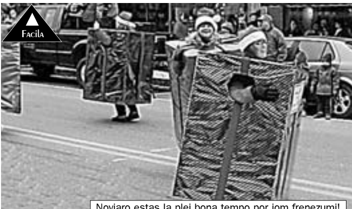
Novjaro estas la plej bona tempo por iom frenezumi!

Tio, cetere, estas tute neimagebla en Rusio. Donackuponoj aŭ mono estas, laŭ multaj rusoj, “nepersonaj” donacoj. Kaj krome, sur donackuponon estas indikita ĝia monvaloro: rusoj preferas, ke oni ne sciu, kiom kostis la donaco.