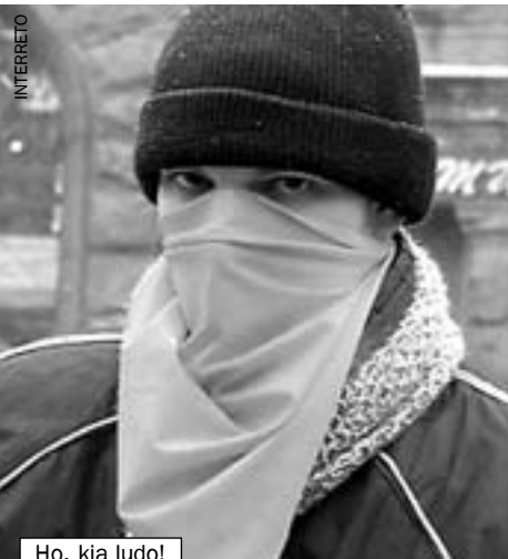
Ho, kia ludo!

sperton de komuna travivaĵo, de sia propra potenco, kiam ili estas kune kaj kiam ili estas gvidataj de adoratataj personoj. Kiam oni montris la vizaĝojn de gejunuloj surplacaj, sur ĉies vizaĝoj estis videbla plena kaj senlima ekzaltigo kaj ĝojo . Kaj individuaj intervjuitaj studentoj tiel klare esprimis siajn sentojn: "Mi estas feliĉa, ĉar mi estis kun samideanoj; en la placo ni povis senpere komuniki kun la plej eminentaj personoj... Nia ĉefa sento estis ĝojo" Kaj alia eĉ pli klare: "Ni vivas en ĉi tiu lando; ĝi apartenas al ni, la junularo. Ni devas helpi al niaj pli aĝaj samlandanoj, montri al ili la ĝustan vojon, kiun ili perdis...". Nu, tion oni instruis al ŝi en Kievo; sed kial ŝi, en nia jam trre merkata socio, ne komprenis ĝis nun, ke nenio estas donata senpage? Ke iuj por partopreni en mitingoj kaj manifestacioj ricevas pagon? Per kio ili repagos al siaj novaj mastroj?