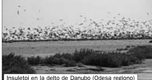
Insuletoj en la delto de Danubo (Odesa regiono)

interesa. Povas pluvi, povas ĝeni kuloj... Estas vere ege malfacila laboro! Kiam ni mem faris filmon, mi komprenis la veran valoron de unu minuto da ekrana tempo. Ĝi havas malantaŭ si tagojn, eĉ semajnojn da observado, atendado kaj “ĉasado” per kamerao. Ĉiu minuto da ekrana tempo konsistas el 24 scenetoj. Kaj imagu, kiom da scenetoj oni povas “enmeti” en 20-minutan filmon! Krome, necesas trovi muzikon, necesas trovi muzikon, necesas trovi muzikon, necesas trovi muzikon, necesas trovi muzikon... Estis vere longa kaj pensiga laboro.