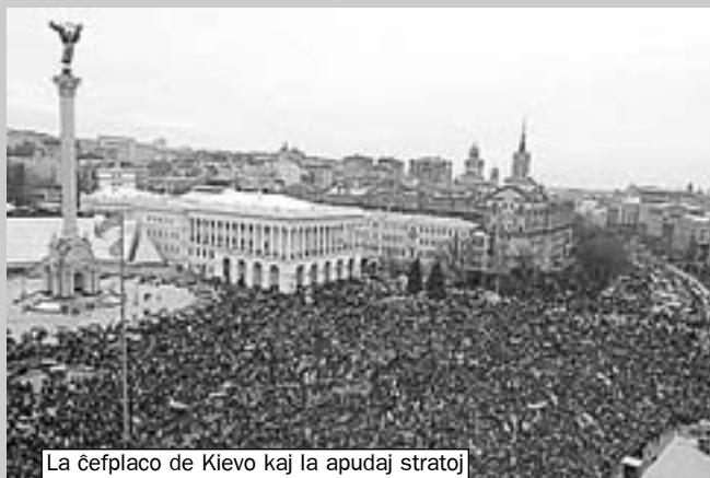
La ĉefplaco de Kievo kaj la apudaj stratoj plenaj je apogantoj de la opozicio